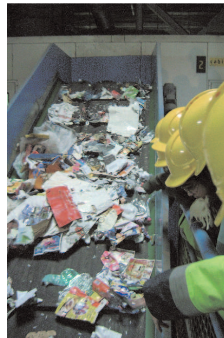
Au centre de tri