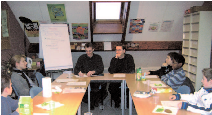
Avec les membres de l'association RSP