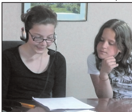
Enregistrement du son